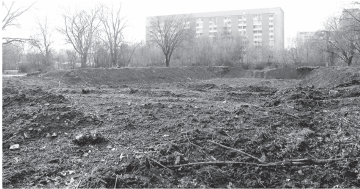
A volt Május 1. strand területe ma

Mindent egybevetve, a sajtósóvivő február 5-i, hétfői nyilatkozata értelmében annak ellenére, hogy egyelőre még nem bontják le a légtartó sátrat, ettől egyelőre nem állt el az önkormányzat. A nyilatkozatoktól függetlenül pedig a szakértők becslése szerint kétséges, hogy a Május 1. strand egyhamar újjáéleddhet hamvaiból.