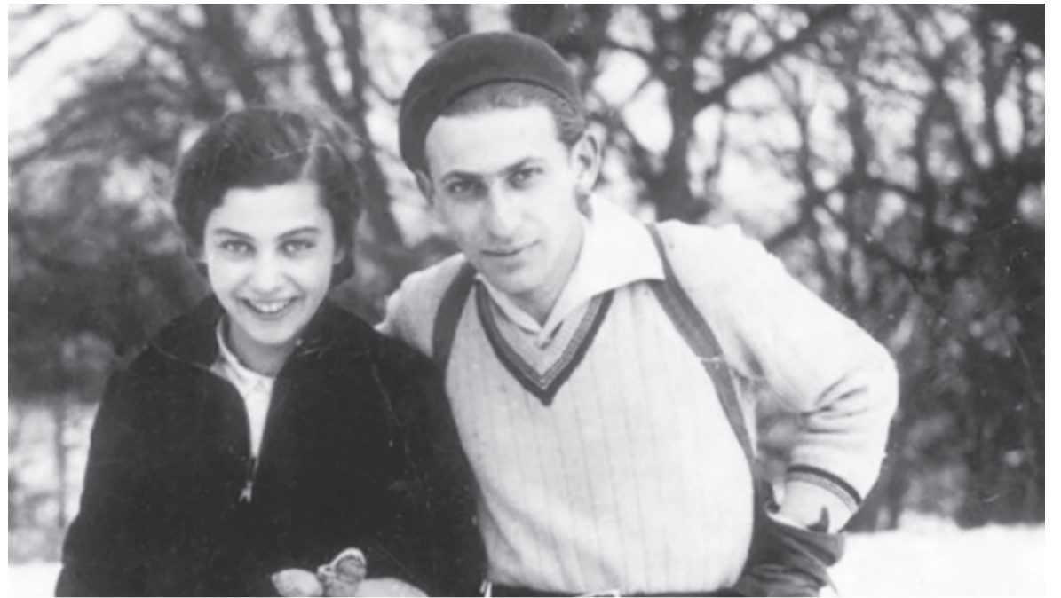
Radnóti Miklós és Gyarmati Fanni

– Mit tudtál meg Radnótiról, a dedikációk, a levelezés mit rajzol ki egy szerzőről? Nem veszélyes-